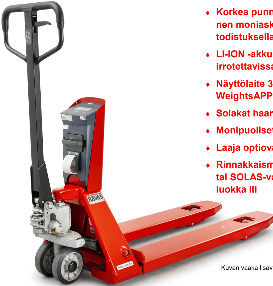
Kuvan vaaka lisävarustein