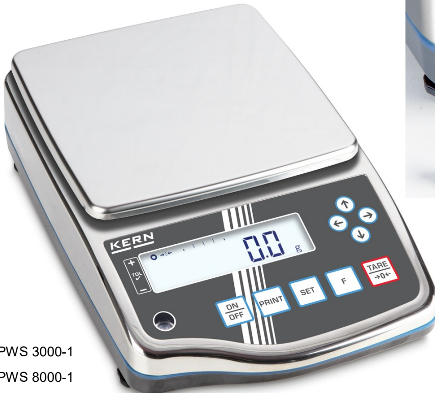
PWS 3000-1 PWS 8000-1