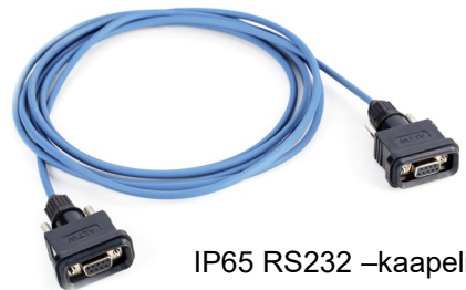
IP65 RS232 -kaapeli