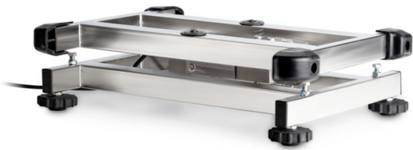
*Punnitustason runko on ruostumatonta terästä