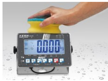
*Helppo pitää puhtaana